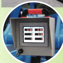
外部モニタ (オプション)