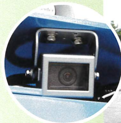
バックカメラ (標準装備)