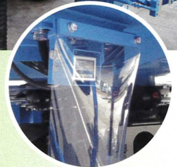
杭芯カメラ (オプション)

キャビン内も広く、操作性を向上! 安全品質の施工をサポートする 施工管理・施工支援システム を搭載しました。